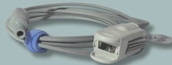
SENSOR + EXTENSIÓN SPO2