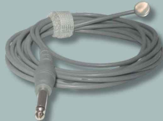
SENSOR DE TEMPERATURA