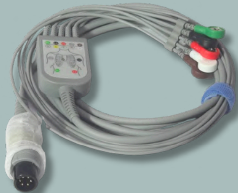
CABLE ECG 5 PUNTAS