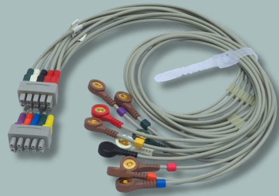
CABLE ECG 10 PUNTAS